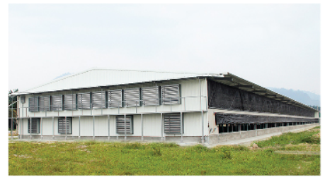
Elevated Slatted Floor Building