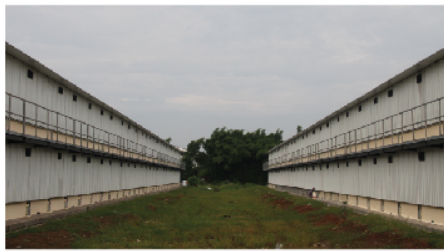
Double Storey Building