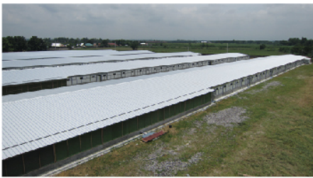
Single Storey Building